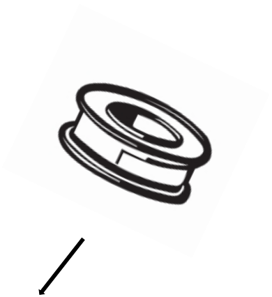
1 x ROTOLO NASTRO TEFLON 12 MT